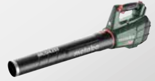
Akkus lombfúvó LB 18 LTX BL 150 km/h / 89 dB Rendelési szám: 601607850**