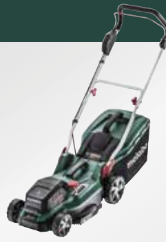
Akkus fűnyíró RM 36-18 LTX BL 36 36 cm / 20-70 mm Rendelési szám: 601716850**