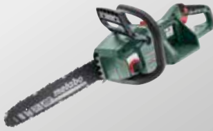
Akkus láncfűrész MS 36-18 LTX BL 40 22 m/s / 36 cm Rendelési szám: 601613850**