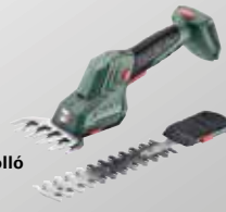
Akkus bokorvágó és fűnyíró olló PowerMaxx SGS 12 Q 20 cm / 11,5 cm Rendelési szám: 601608850**