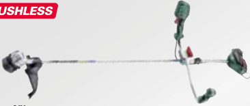
Akkus fűkasza FSB 36-18 LTX BL 40 Kétkezes markolat / 40 cm Rendelési szám: 601611850**