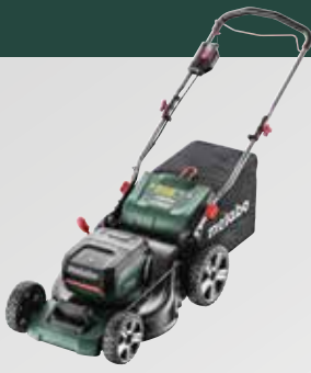
Akkus fűnyíró RM 36-18 LTX BL 46 46 cm / 25-80 mm Rendelési szám: 601606850**