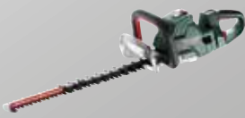
Akkus sövényvágó HS 18 LTX BL 55 50 cm / 3400/min. Rendelési szám: 601722850**