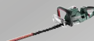
Akkus sövényvágó HS 18 LTX BL 65 60 cm / 3400/min. Rendelési szám: 601723850**