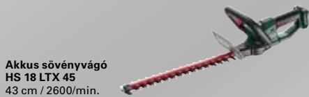
Akkus sövényvágó HS 18 LTX 45 43 cm / 2600/min. Rendelési szám: 601717850**