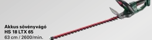
Akkus sövényvágó HS 18 LTX 65 63 cm / 2600/min. Rendelési szám: 601719850**