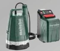
Akkus bűvár- és esőtároló hordó szivattyú TPF 18 LTX 2200 22m / 2200 l/h Rendelési szám: 601729850**