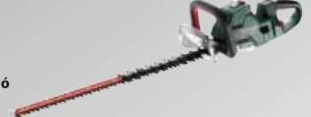
Akkus sövényvágó HS 18 LTX BL 75 70 cm / 3400/min. Rendelési szám: 601724850**