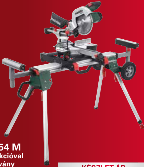
KGS 254 M húzófunkcióval + gépállvány KSU 251