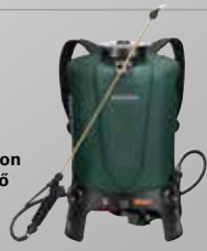
18 Voltos akkus hátán viselhető permetező készülék RSG 18 LTX 15 15 l / 1-3 bar Rendelési szám: 602038850**