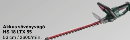
Akkus sövényvágó HS 18 LTX 55 53 cm / 2600/min. Rendelési szám: 601718850**